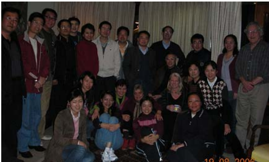
(师生联欢 Happy Moment)